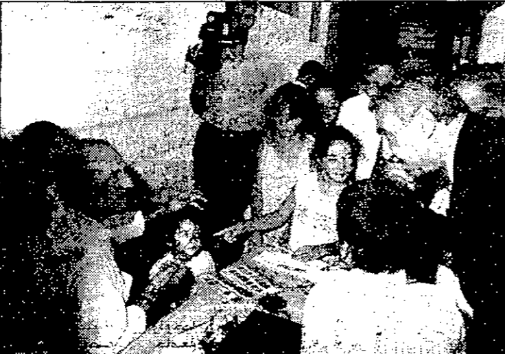
● من الفعاليات